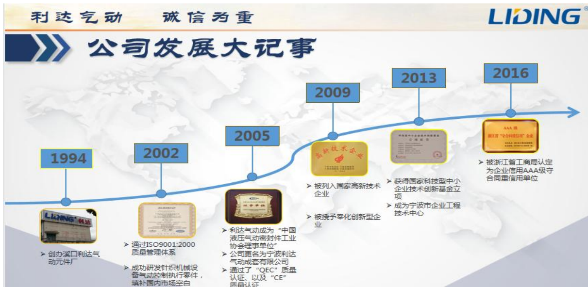
图表2.1-1 公司发展大事记

利达公司生产产品不断扩大。公司在向标准化技术发展上，成效斐然。公司将继续奋进，争取新成绩。